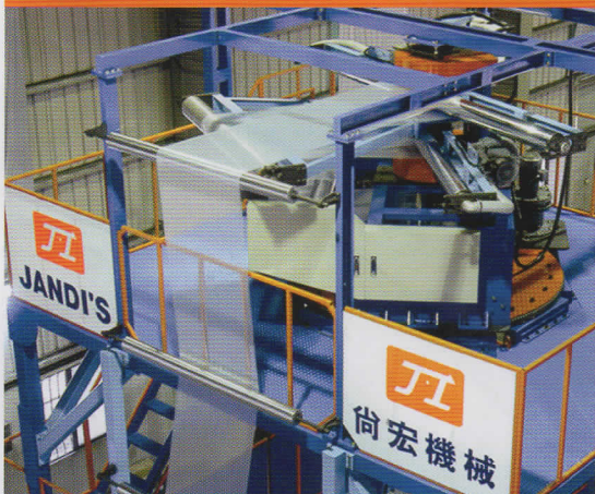
Horizontal type oscillation haul off 平行式上旋轉引取裝置